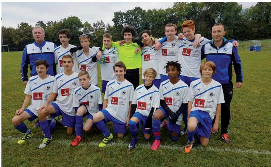
Montée en excellence pour les U15

Les U15, invaincs pendant 22 matchs accèdent au plus haut niveau parmi les 8 meilleures équipes du département : assiduité, présence aux entraînements, un vrai groupe de copains.