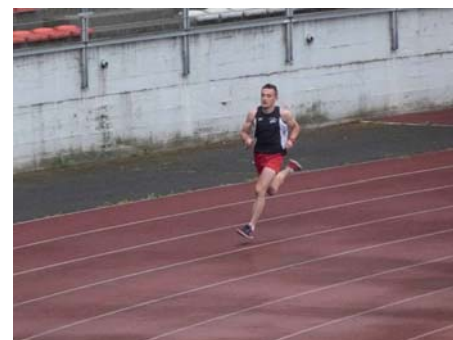
4x400 m - Equipe de l'Ain au Concours Régional PSSP