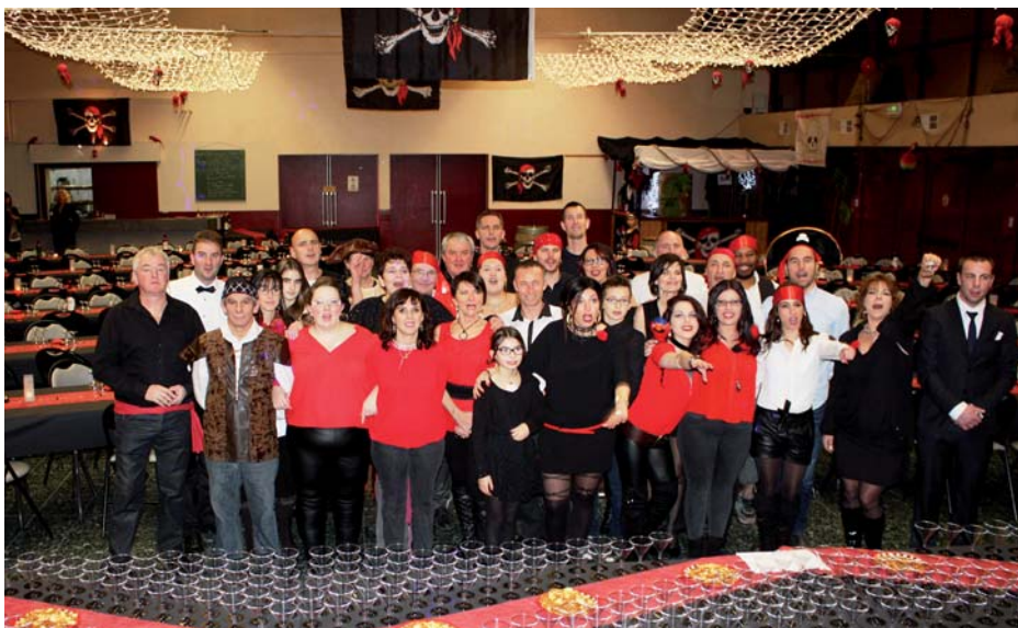
Soirée du Réveillon

C'est dans une tenue inhabituelle, que les membres du comité et bénévoles du Football Sud Gessien ont reçu leurs invités lors de la soirée du réveillon.