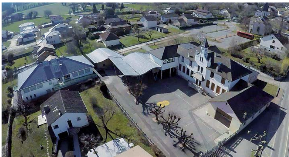
L'agrandissement de l'école

Les inscriptions des enfants nés en 2014 (ou avant) se feront conjointement en mairie puis à l'école les 12 et 13 avril 2017 .